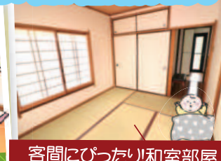
客間にぴったり!和室部屋