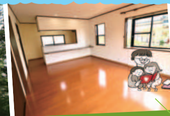
16.5帖の広々リビングルーム