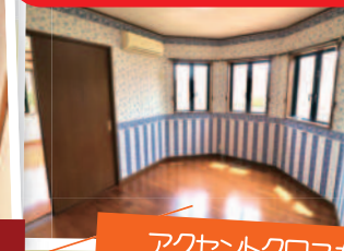
アクセントクロスがオシャレな洋室