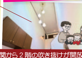
玄関から2階の吹き抜けが開放的