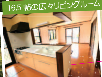
ピカピカのカウンターキッチン